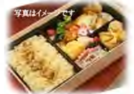
写真はいメージです 毎回コースにちなんだ昼食をご用意しています。 今回は評判のあじ彩 特製お弁当です！