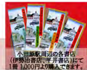
小田原駅周辺の各書店 (伊勢治書店、平井書店)にて 1冊 1,000円より購入できます。

テキスト希望の方は、 『小田原まちあるき指南帖4』代として 別途 1,000円 をいただきます。