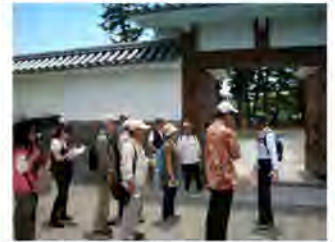
ベテランガイドが丁寧にご案内します。

小田原駅 — 旧小田原御用邸 — 御幸の浜 — 滄浪閣 — 小田原文学館 — 諸白小路・旧榎本子爵邸 — 対潮閣・秋山真之終焉の地 — 瓜生外吉海軍大将像 — 清閑亭・旧黒田長成邸 — 商工会議所