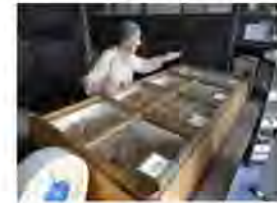
さらに、成績に関わらず、抽選で小田原ならではの特産品をプレゼント！